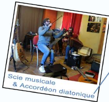
Scie musicale & Accordéon diatonique