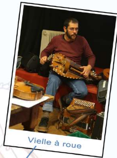
Vielle à roue